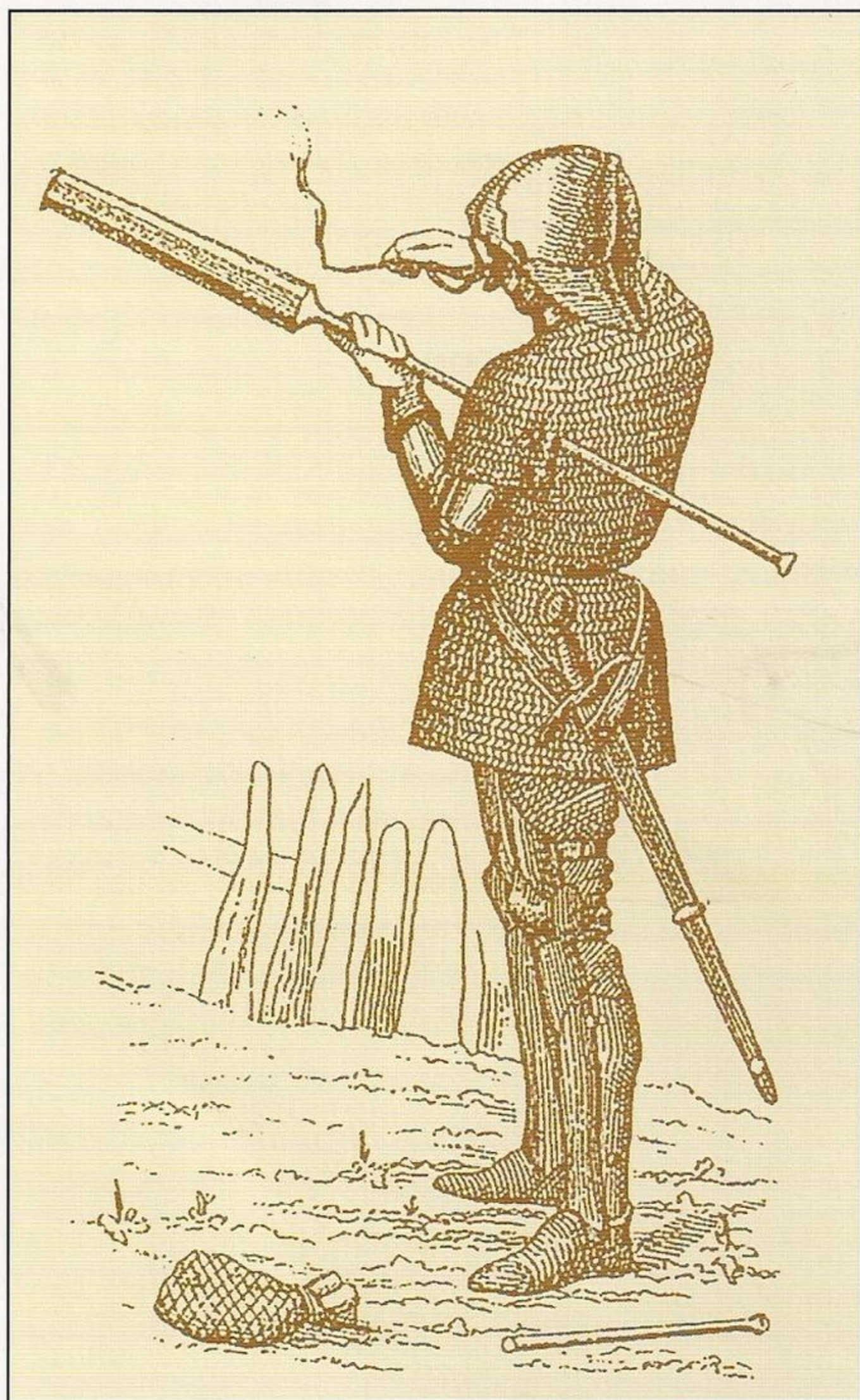
Soldado de a pie del siglo XV armado con un cañón de mano. Sujeta el palo de la culata debajo del brazo izquierdo mientras aplica la mecha encendida con la mano derecha.

criados de la pequeña nobleza y la aristocracia (una clase muy reducida entre los husitas) estaban bien provistos de armas y tenían al menos un yelmo y una coraza o una camisa de malla, la mayoría se protegían sólo con unos sobretodos acolchados. Los que tenían armas de asta convencionales, como alabardas, solían ser tropas “regulares”, mejor equipadas. Otras armas de asta tenían un notable aspecto agrícola. Los mayales, probablemente transformados por el herrero del pueblo a partir de la herramienta desgranadora original, eran especialmente populares, y las podaderas eran ideales para derribar a los jinetes. Es posible que una reja de arado fuera el origen de un arma que parecía la versión primitiva de la alabarda suiza.