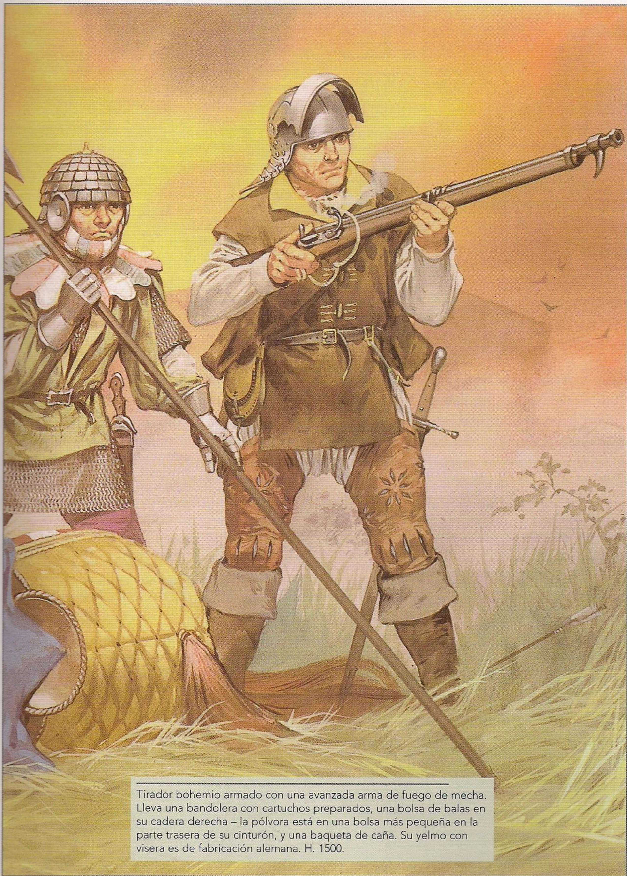
Tirador bohemio armado con una avanzada arma de fuego de mecha. Lleva una bandolera con cartuchos preparados, una bolsa de balas en su cadera derecha – la pólvora está en una bolsa más pequeña en la parte trasera de su cinturón, y una baqueta de caña. Su yelmo con visera es de fabricación alemana. H. 1500.