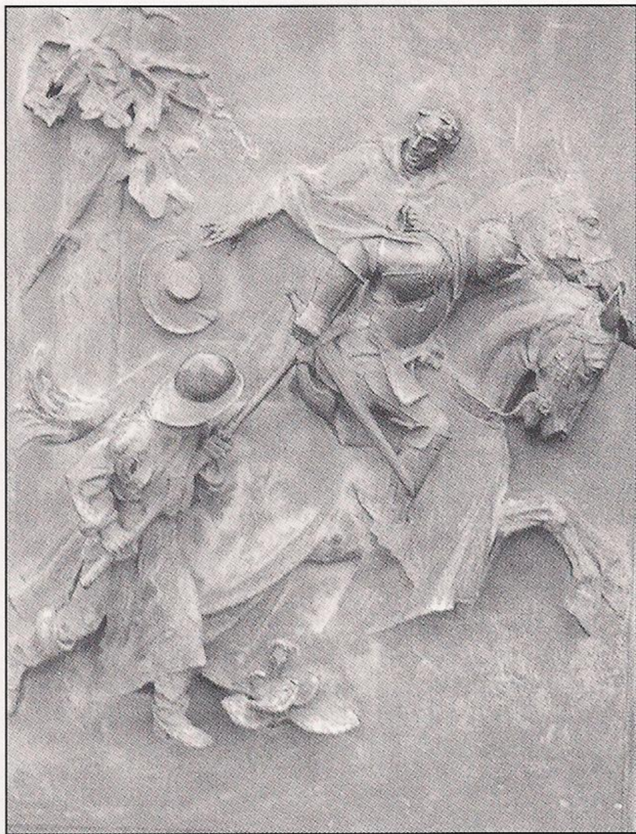
El momento decisivo de la batalla de Domazlice, el 14 de agosto de 1431, fue la retirada de los cruzados llenos de pánico. Este detalle de la puerta del monumento conmemorativo de Zizka en Praga muestra al cardenal Cesarini perdiendo su sombrero mientras huye.

El cardenal encabezó posteriormente la delegación imperialista en una conferencia de paz, pero no antes de que los husitas emprendieran otras de sus llamadas “hermosas cabalgatas”, especialmente una invasión de Prusia contra los Caballeros Teutónicos. Lle-