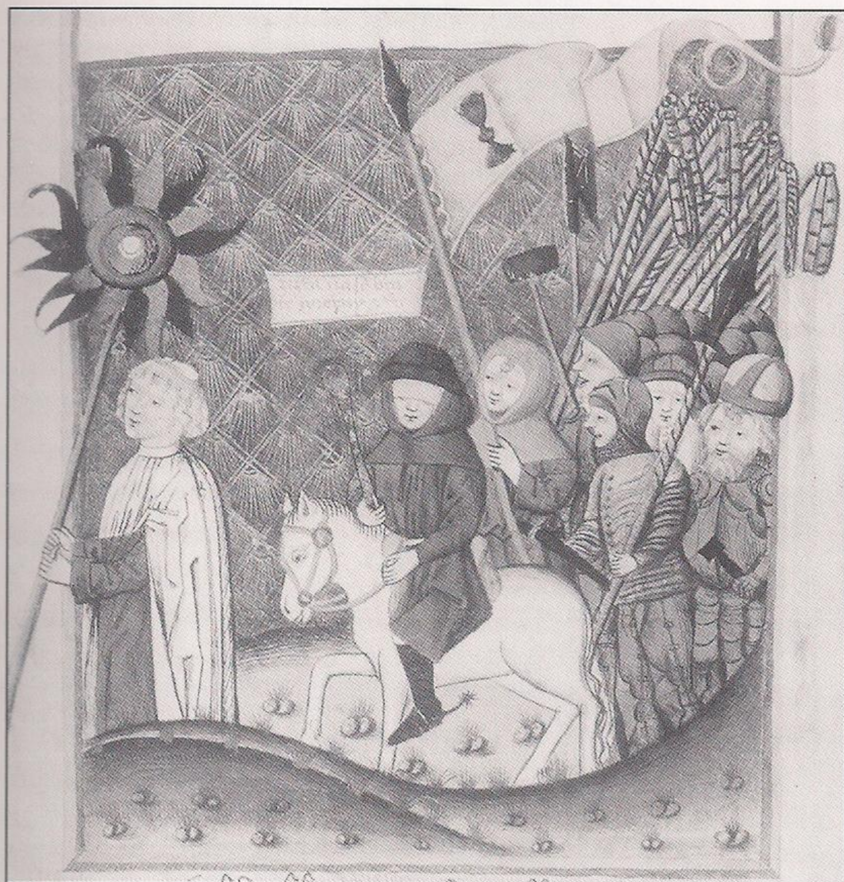
Jan Zizka dirigiendo a los husitas, en un manuscrito medieval. Zizka (en el centro, montando un caballo blanco) está ciego y tiene los ojos vendados. La columna avanza bajo una bandera con un cáliz negro. Un sacerdote, que lleva la sagrada hostia, camina delante de la formación. (Biblioteca Nacional, Praga)

ciplina militar. Se garantizan penas severas a todos los “hombres desleales, desobedientes, mentirosos, ladrones, jugadores, saqueadores, borrachos, blasfemos, libertinos, adúlteros, prostitutas, adúlteras o a cualquier otro pecador manifiesto, ya sea hombre o mujer. Éstos serán desterrados o perseguidos [...] y todos estos crímenes serán castigados con azotes, garrotazos, o también con la decapitación, la horca, el ahogamiento o la muerte en la hoguera [...] sin excepción y sin distinción de rango o sexo”.