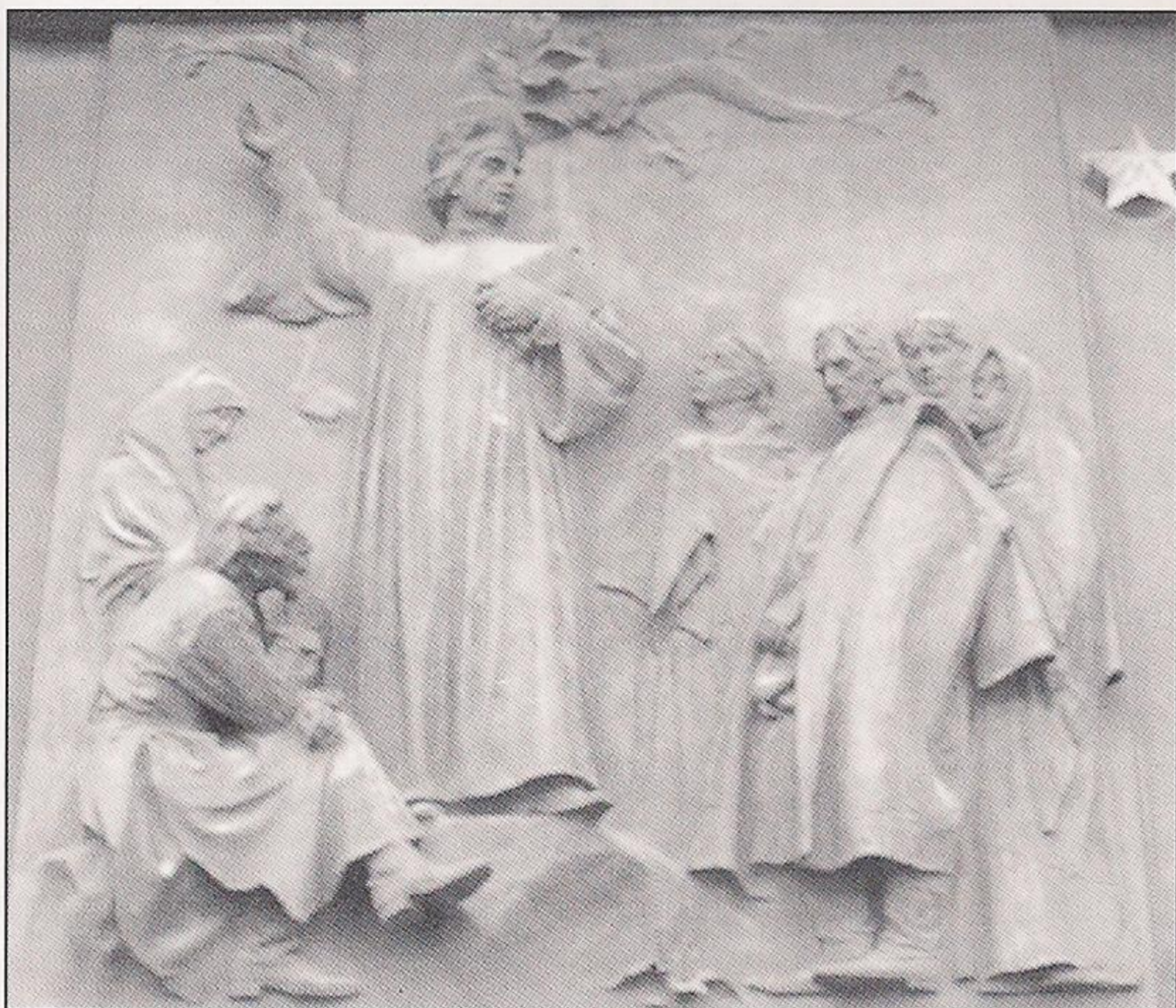
Escultura en relieve de Jan Hus predicando a los campesinos al aire libre. Detalle del monumento conmemorativo de Zizka en Praga.

Hus era un predicador con un gran magnetismo que enfurecía a la poderosa institución eclesiástica. Fue acusado de herejía y excomulgado, pero por razones políticas, fue apoyado por el rey y emperador Venceslao (Vaclav) IV, hijo de Carlos IV, cuya reforma de la uni-