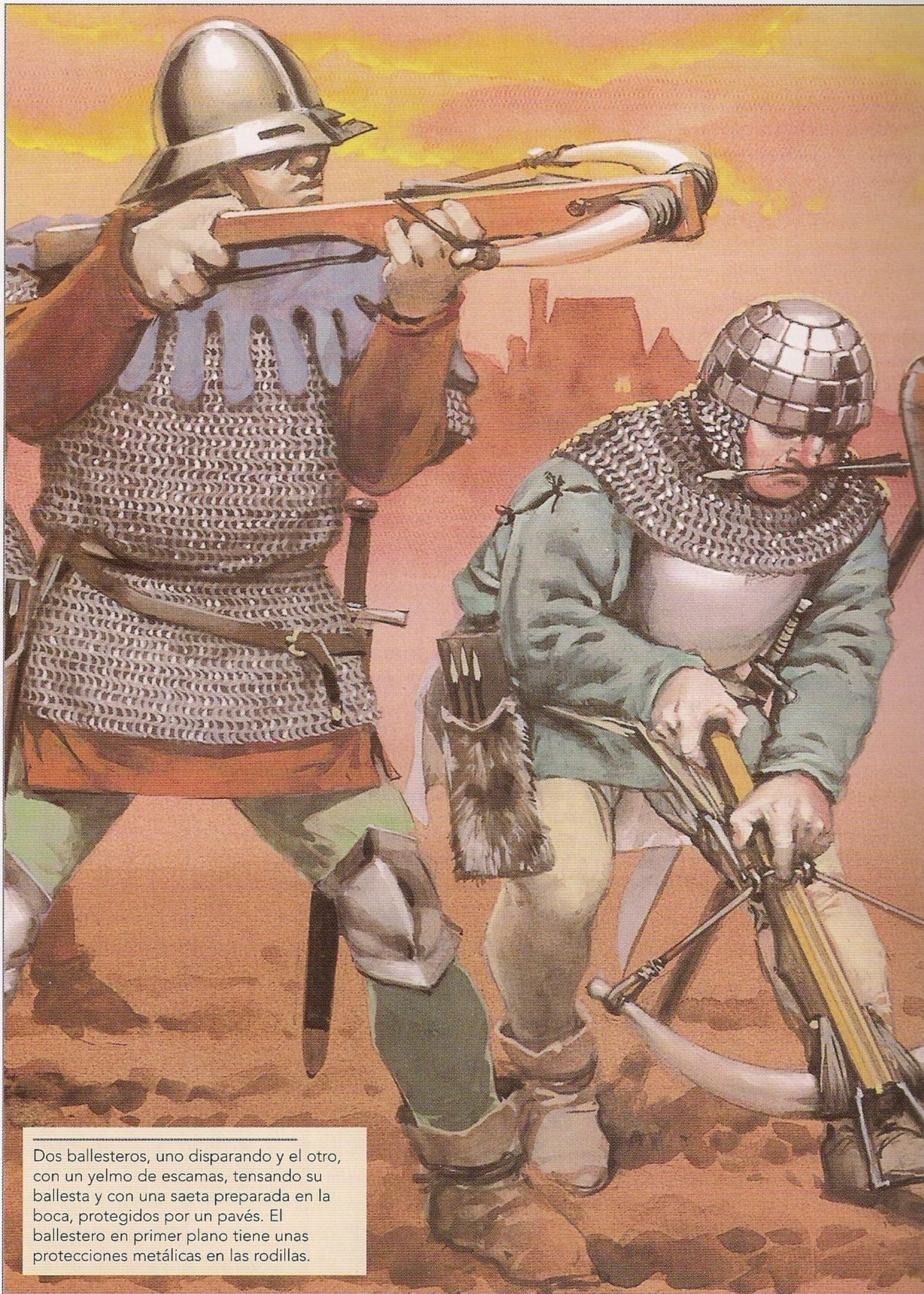
Dos ballesteros, uno disparando y el otro, con un yelmo de escamas, tensando su ballesta y con una saeta preparada en la boca, protegidos por un pavés. El ballestero en primer plano tiene unas protecciones metálicas en las rodillas.